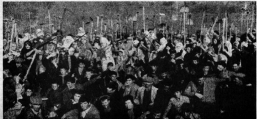
BİGA'DA KARGI ÇİFTLİĞİNDE KÖYLÜLERİN MÜCADELESİ

Fağızın içreç yüzünü her gün kendi yurdunda somut örnekleriyle gören Türkiye halkının, Nazizmin paralı avukatlarına verecek sadakası yoktur!