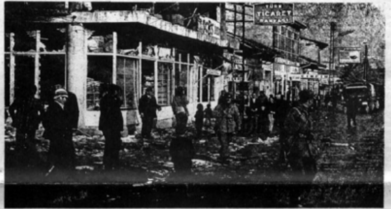
FAŞİST ZORBALAR TOKAT'TA DUKÜNLARINI, İŞYERLERİNİ, KİTAPÇILARINI YAĞMA ETTİLER.